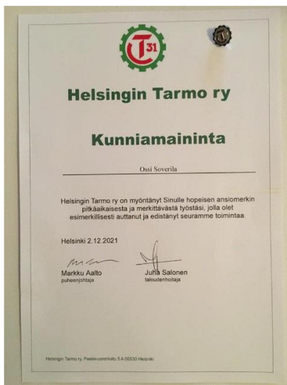
Amin Nuri pronssinen